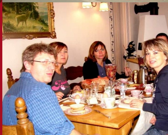
Pension Zur Bodehexe